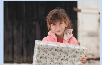
Bild: Mädchen aus Ukraine, Aktion Weihnachtspäckli

Die Geschenke an Kinder und Erwachsene in Osteuropa lösen grosse Freude aus. Alle Informationen zum Mitmachen: Flyer, tel. Anfragen oder www.refkinini.ch/aktion . An folgenden Tagen und Zeiten können Sie die Päckli bei unseren Sammelstellen abgeben: