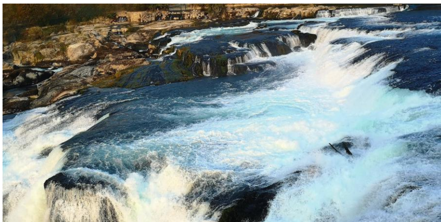
Rheinfall bei Schaffhausen: Immer in Bewegung, immer neu.